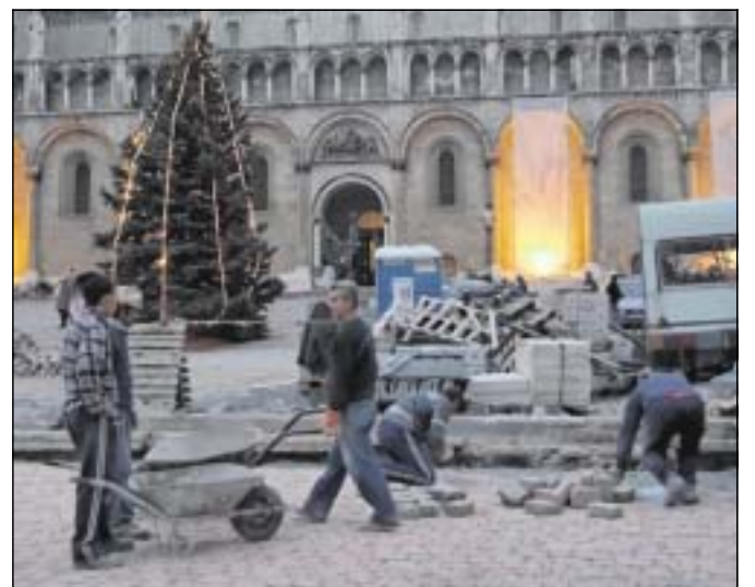
Ein Großteil des Pécs' Stadtzentrums ist noch Baustelle. Die Stadt will 2010 ein gutes Bild abgeben.

Sollten die Glieder nach dieser ausschweifenden Besichtigungstour zu sehr geschunden sein, dürfen sie nicht allzu großen Luxus erwarten. Ein Fünf-Sterne-Hotel gibt es nicht - soll aber bis 2010 gebaut werden. Wer darauf nicht verzichten möchte, der steige jetzt wieder in den Bus, lasse das Lichtermeer hinter sich und schaukele zurück nach Budapest.