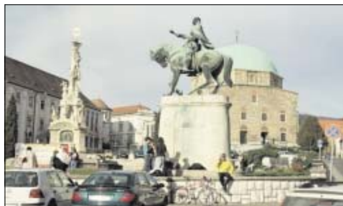
Inmitten historischer Bauten und vieler Denkmäler herrscht Alltags. Autos, Radfahrer und Fußgänger bevölkern die Innenstadt.

Zweites kulturelles Standbein neben der Architektur ist die Malerei. Galerie reiht sich an Galerie. Eines der berühmtesten, malenden Kinder Pécs' ist Victor Vasarely, der durch sein Spiel mit der Perspektive bekannt wurde. Sehenswert auch das Museum mit Werken Tivadar Csontváry Kosztkas,