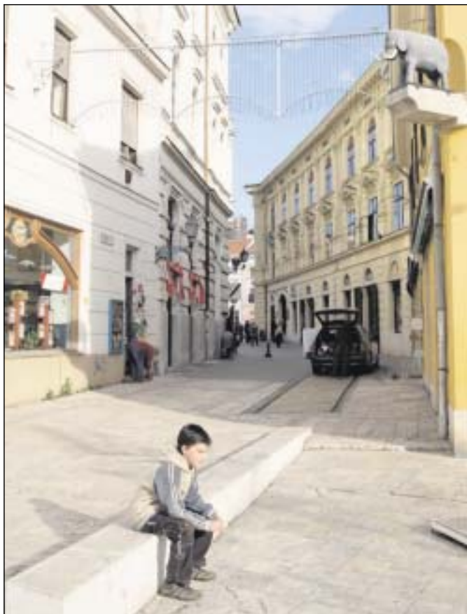
Neben den Bauarbeiten und zunehmenden Touristenströmen gibt es immer noch kleine, melancholisch anmutende Gassen.

Großprojekte sollen die Kulturhauptstadt für viel Geld konkurrenzfähig machen