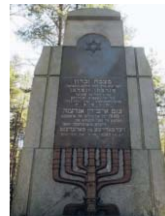
Mahnmal in Paneriai

1948 entsteht das erste Denkmal in Paneriai. Als Opfer der Faschisten werden auch Juden erwähnt. 1952 ersetzen es die Sowjets durch eine Inschrift: „Hier erschossen die Nazis 100 000 Sowjets“. Erst 1990 kommt ein neuer Text auf Hebräisch hinzu. Heute gehören zur Gedenkstätte drei Steintafeln, ein Museum, ein Mahnmal für 70 000 ermordete Juden und mehrere andere Mahnmale.